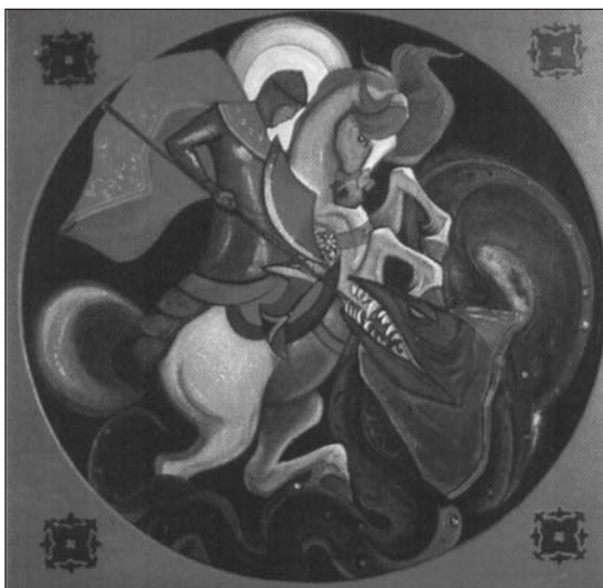
Свет побеждает тьму Н.К. Рерих

Семь Великих Посланников Света вступили в битву с силами тьмы. Эта битва, начавшись со времён погибшего в катаклизмах материка Атлантиды, длилась с перерывами тысячи лет. И только в середине прошлого столетия Великий Владыка — Архистратиг Михаил в христианстве — победил Князя Тьмы, который был изгнан с Земли на Сатурн. Но приспешники его на Земле ещё остались и ведут последний бой перед своим полным уничтожением в период Второго