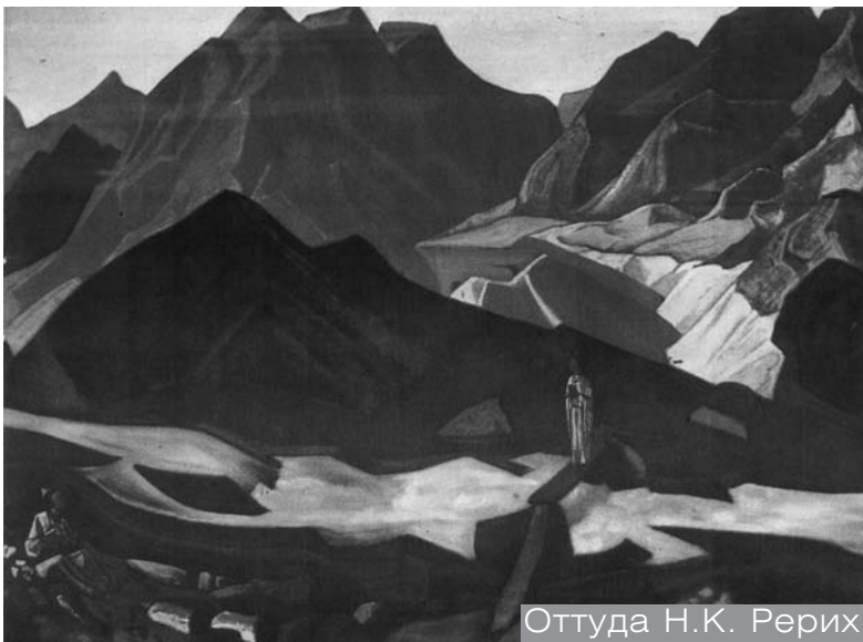
Оттуда Н.К. Рерих

Для того, чтобы принести человечеству открытия, которые облегчат ему жизнь, воплощаются на Земле сотрудники Братства. Среди них известные всем имена Святых Подвижников христианства: Преподобного Сергия Радонежского, Серафима Саровского, Франциска Асизского, великих мудрых царей Соломона и Акбара, учёных — Фрэнсиса Бекона, Галилея, Томаса Вогана, Парацельса, Фламмарiona и многих других.