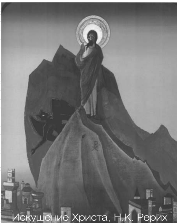
Искушение Христа, Н.К. Рерих

Когда Ему говорили о знаках звёзд, Он хотел знать решение, но азбука Его