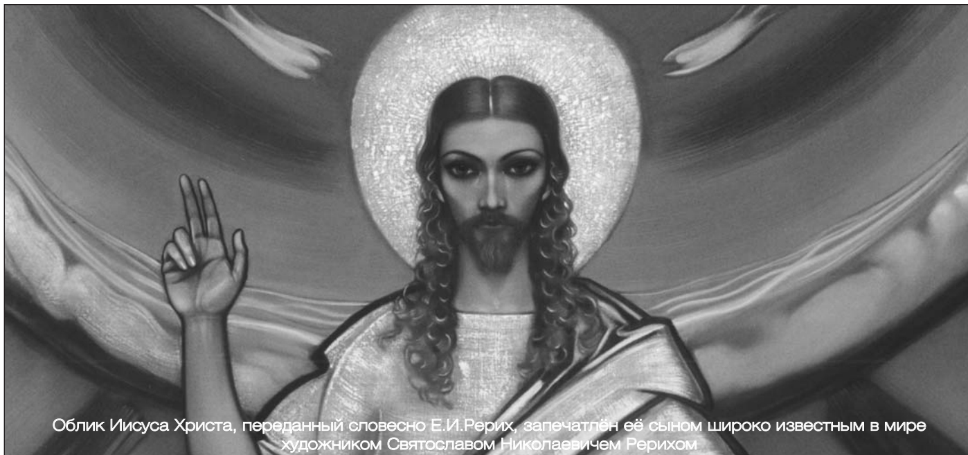
Облик Иисуса Христа, переданный словесно Е.И.Рерих, запечатлён её сыном широко известным в мире художником Святославом Николаевичем Рерихом

Кто-то скажет, что об этом уже можно забыть за давностью лет. Но существует закон причин и следствий, непреложный Космический Закон кармы. Карма людей, извративших Космическое Учение Христа, лежит на них и их последователях. Потому мы видим сей-